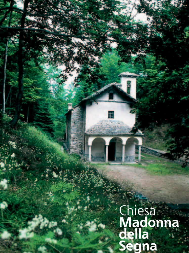
Chiesa Madonna della Segna